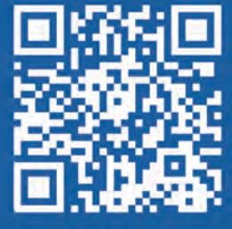
Diseño: Formation Studio