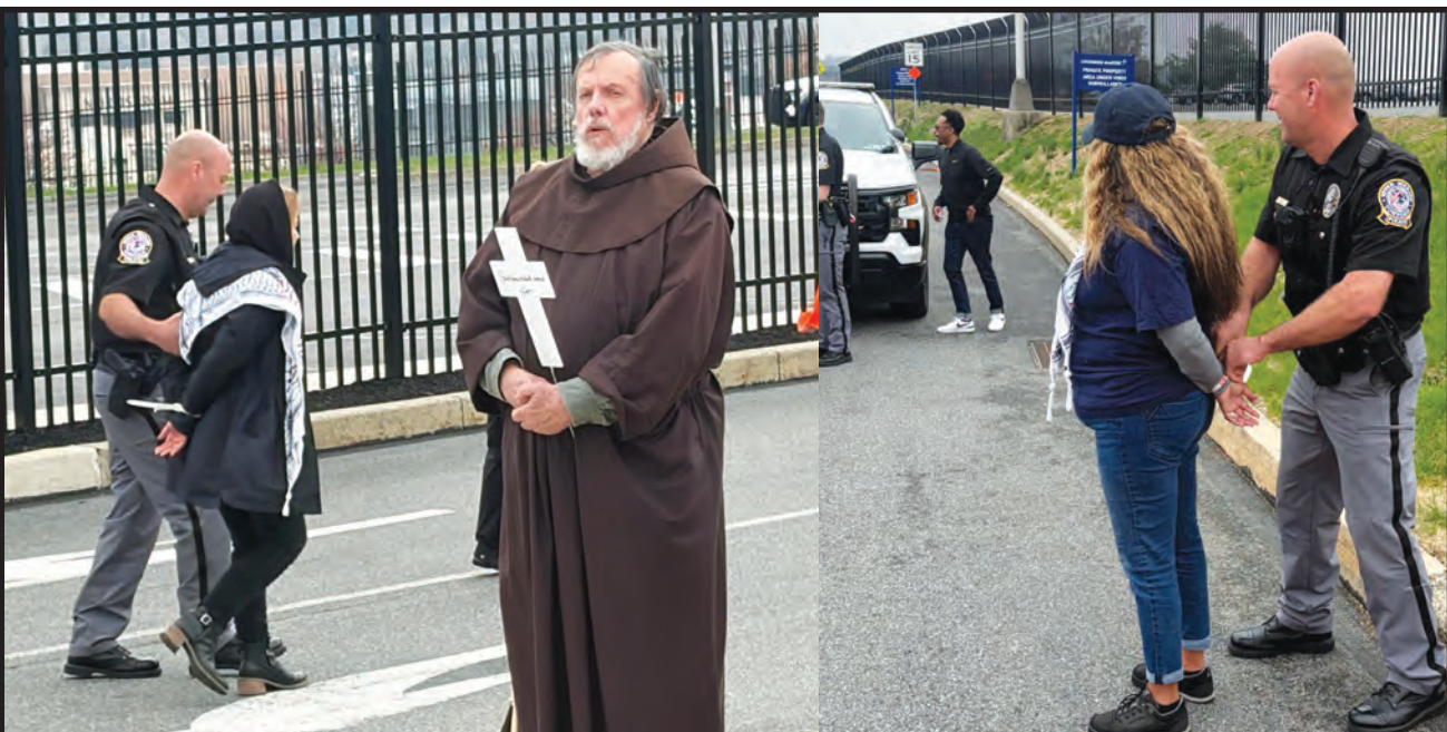
Red Letter Christians' Protest of Lockheed Martin ends with 20+ people arrested on Good Friday , p. 10 / Protesta de Red Letter Christians contra Lockheed Martin termina con 20+ personas arrestadas el Viernes Santo , p. 10.