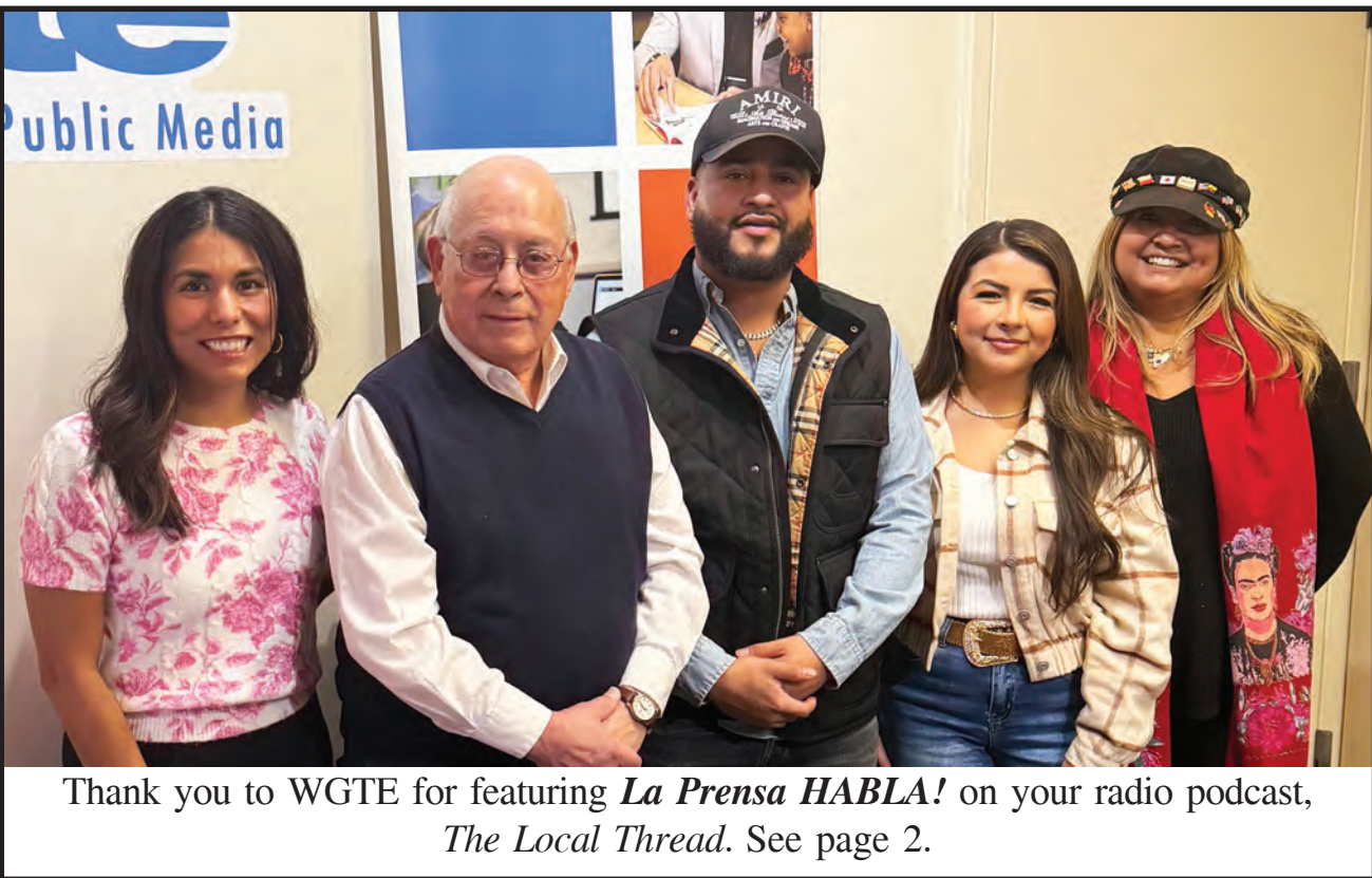
Thank you to WGTE for featuring La Prensa HABLA! on your radio podcast, The Local Thread . See page 2.