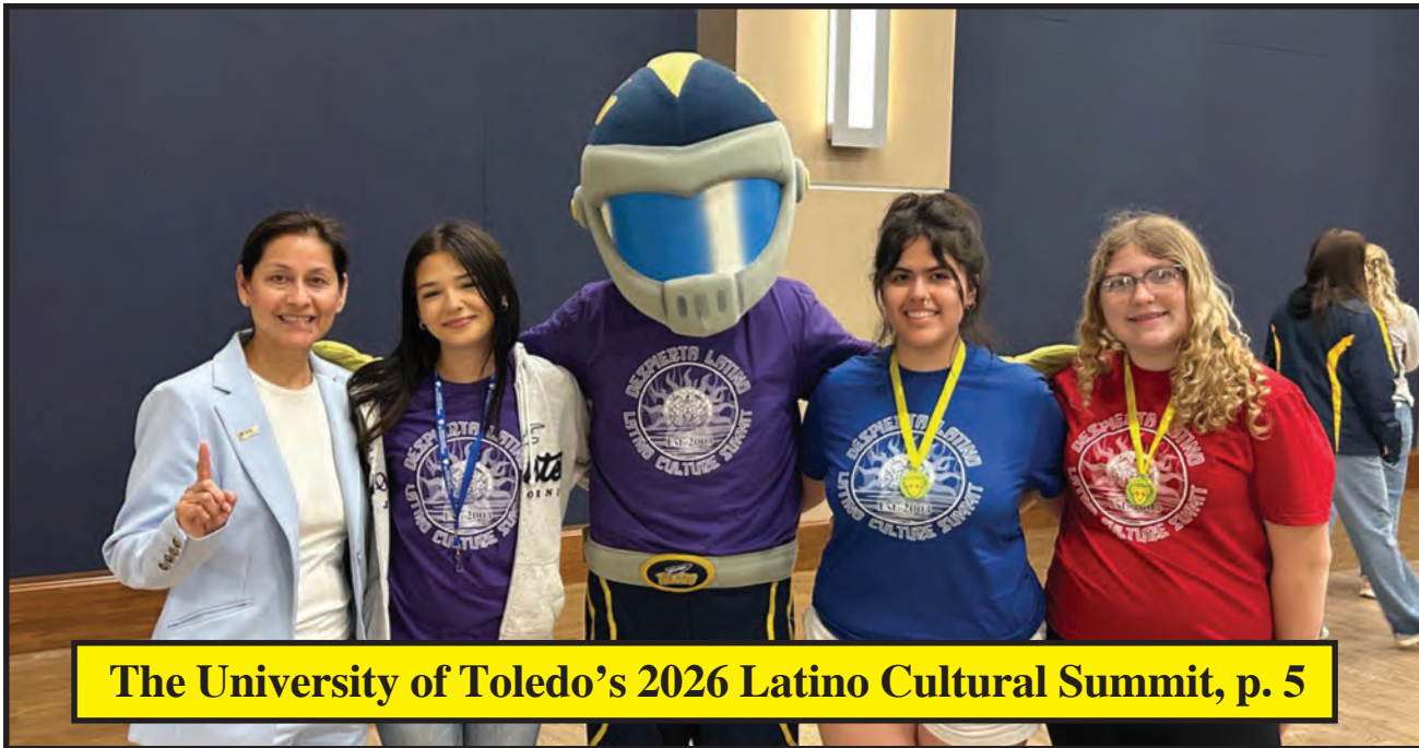
The University of Toledo's 2026 Latino Cultural Summit, p. 5